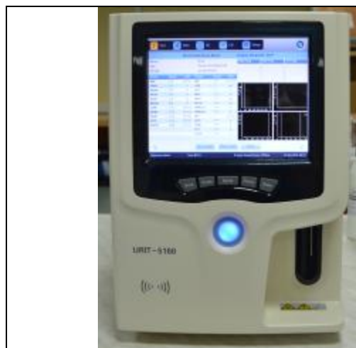
Рисунок 1а – Общий вид анализаторов гематологических автоматических модели URIT-5160

Схема пломбировки от несанкционированного доступа, обозначение места нанесения знака поверки представлены на рисунках 2а и 2б соответственно.