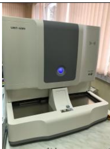
Рисунок 1б – Общий вид анализаторов гематологических автоматических модели URIT-5380