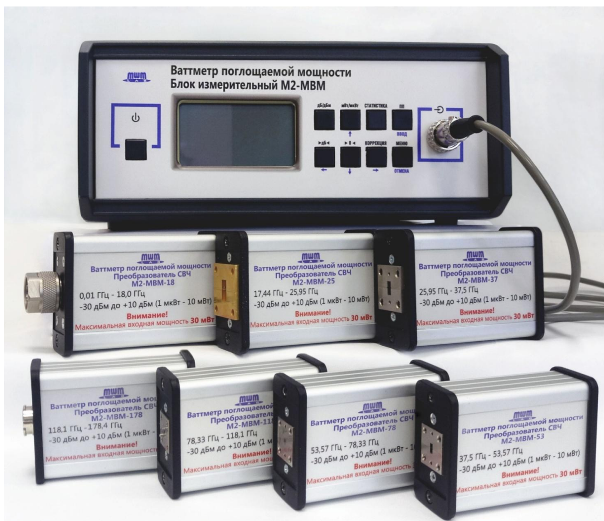
Рисунок 2 – Общий вид ваттметров M2-MBM

Общий вид ваттметров M2-MBM приведен на рисунке 2.