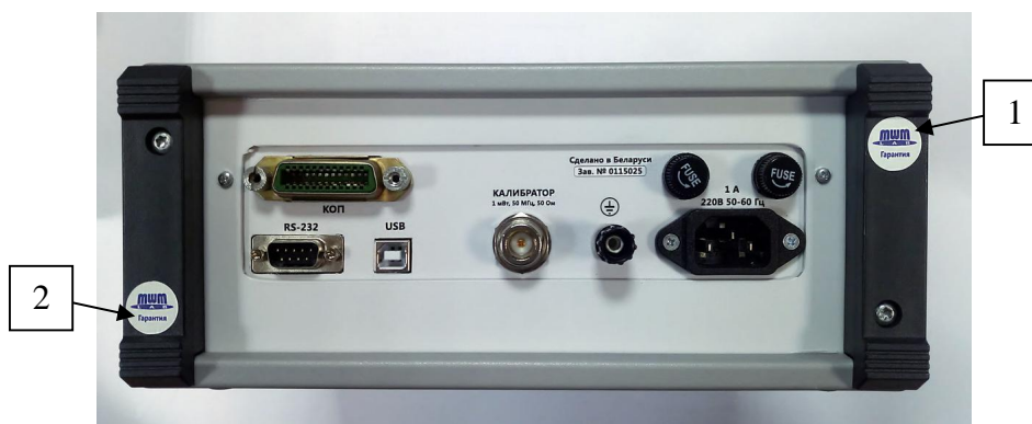
1, 2 – места пломбирования от несанкционированного доступа