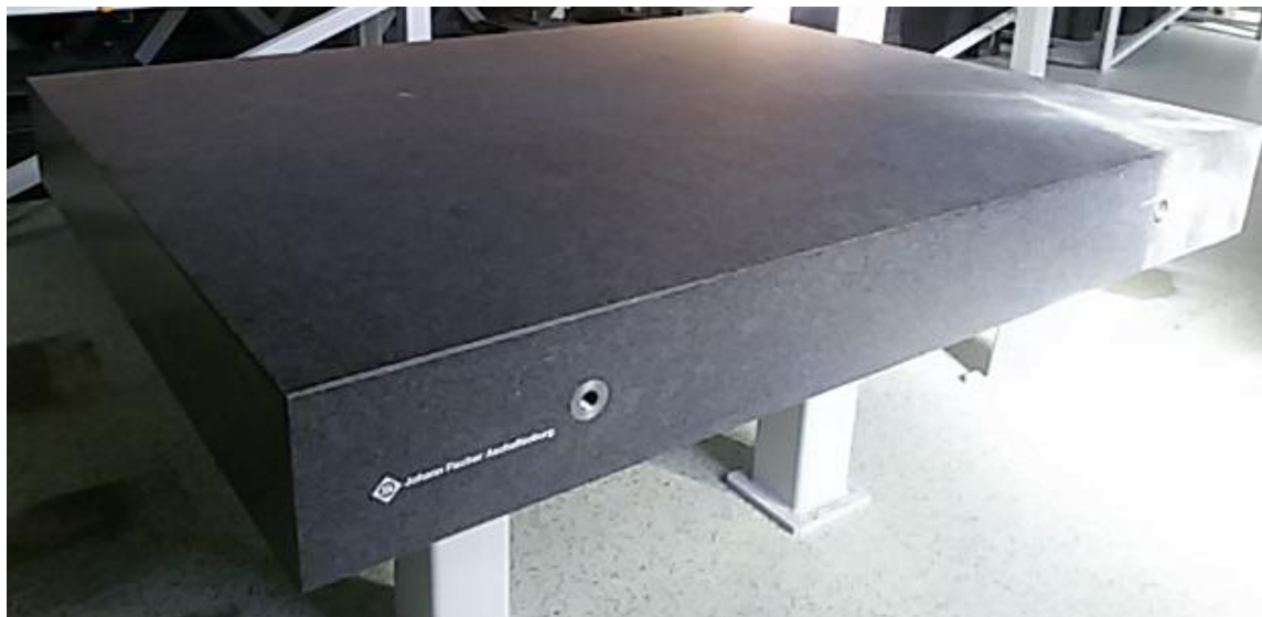
Рисунок 1 – Внешний вид плиты

Внешний вид плиты приведен на рисунке 1.