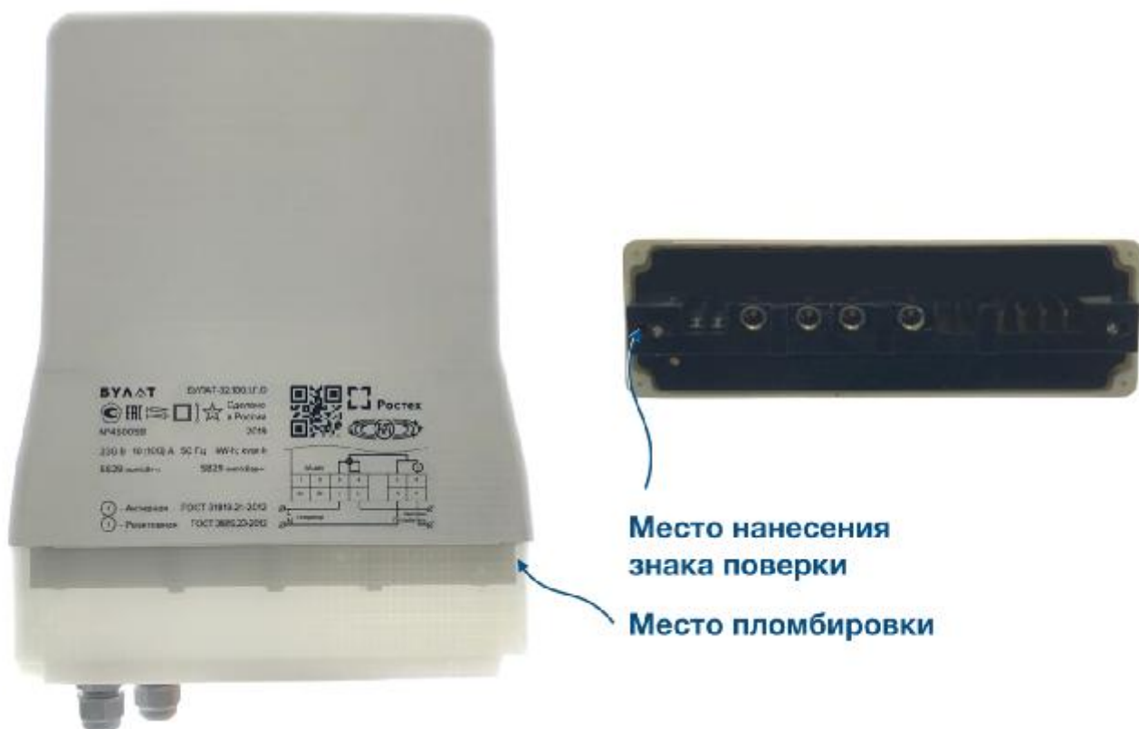
Рисунок 2 - Внешний вид счётчиков в корпусе «Тип 2»