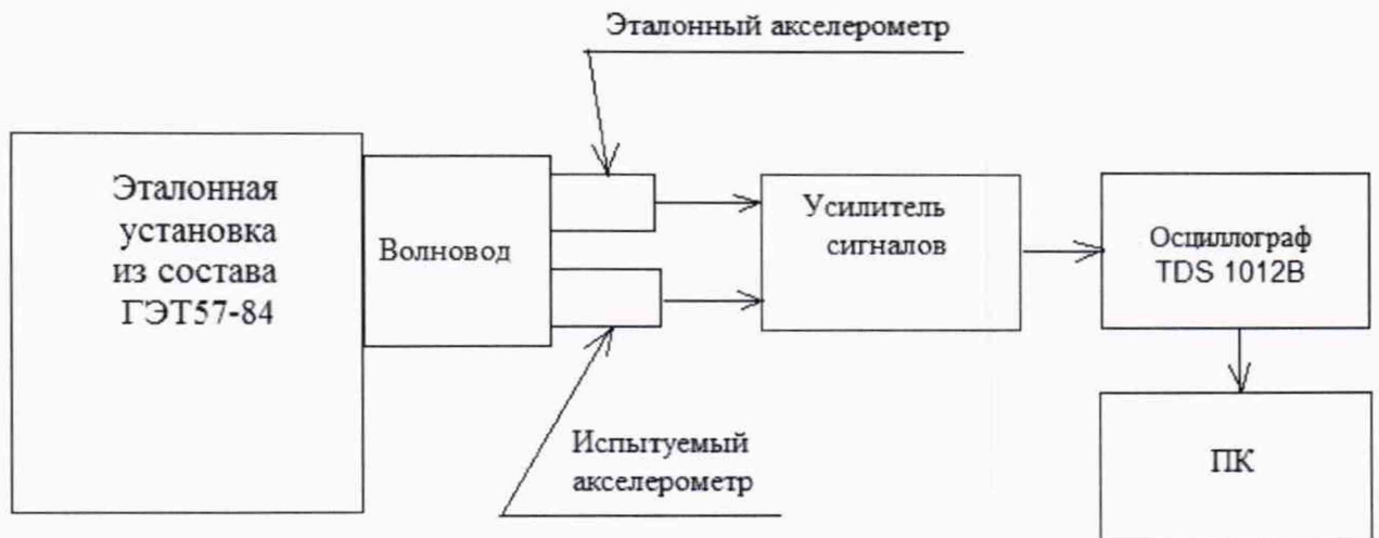
Рисунок А.1 – Схема подключения акселерометра при определении коэффициента преобразования, проверки диапазона амплитуд преобразуемых ударных ускорений