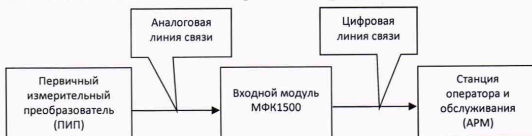
Рисунок 1 - Типовая блок - схема ИК

Типовая блок-схема ИК САУ БППГ приведена на рисунке 1.