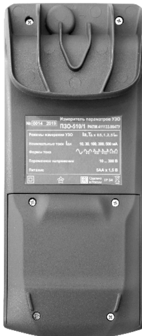
Рисунок 4 – Общий вид измерителей параметров УЗО ПЗО-510/1. Вид сзади