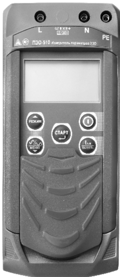
Рисунок 1 – Общий вид измерителей параметров УЗО ПЗО-510. Вид спереди

Общий вид приборов представлен на рисунках 1 – 4. Схема пломбировки от несанкционированного доступа представлена на рисунке 5.