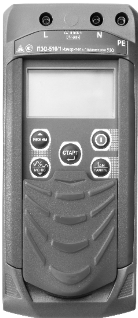
Рисунок 3 – Общий вид измерителей параметров УЗО ПЗО-510/1. Вид спереди