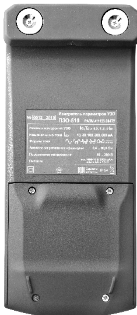
Рисунок 2 – Общий вид измерителей параметров УЗО ПЗО-510. Вид сзади