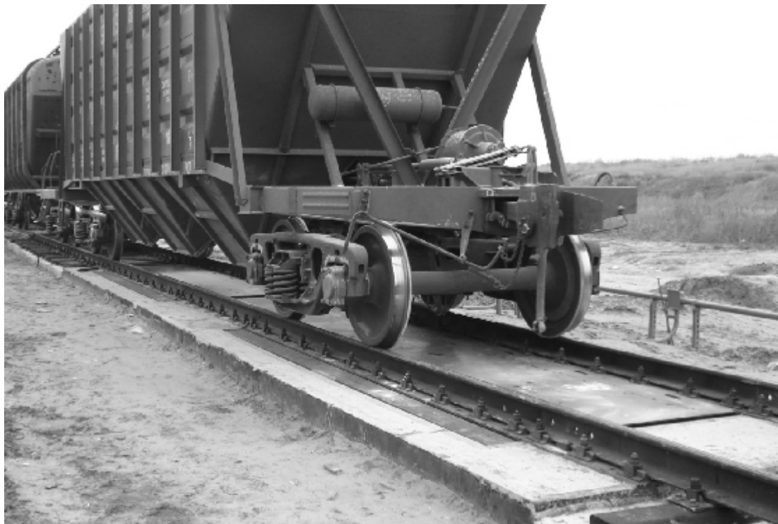
Рисунок 1 – Общий вид ГПУ

Общий вид ГПУ представлен на рисунке 1, приборов весоизмерительных М1РС-01 и М1РС-03, – на рисунке 2, схема пломбировки от несанкционированного доступа – на рисунке 3.