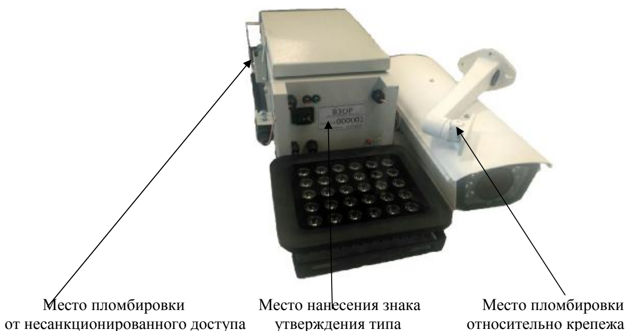
Рисунок 1 – Общий вид комплексов

Общий вид комплексов, а также схема пломбировки от несанкционированного доступа, обозначение места нанесения знака утверждения типа, схема пломбировки относительно крепежа представлены на рисунке 1.