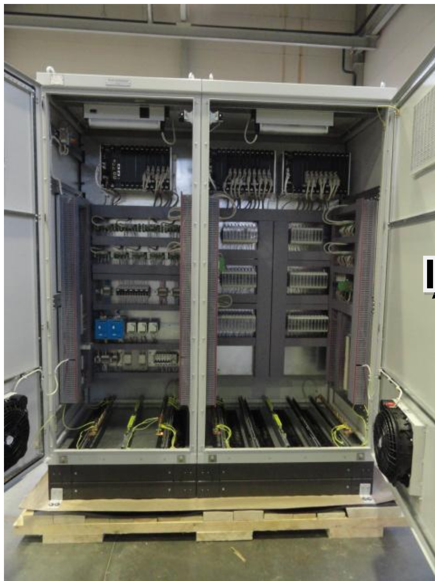
Рисунок 1 - Общий вид шкафа ГТУ