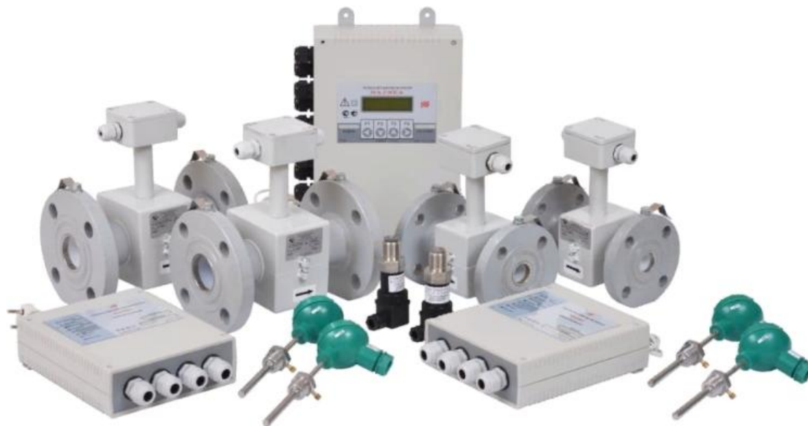
Рисунок 4 – Общий вид теплосчетчиков

Пломбировка от несанкционированного доступа к настройкам теплосчетчика осуществляется с помощью наклейки, которая наклеивается на переключатель, расположенную на плате вычислителя, и на корпус регистратора расхода отдельно-выносного исполнения (при его наличии), с нанесением знака поверки на наклейку. Средства измерений, входящие в состав теплосчетчика, пломбируются в соответствии с описанием типа на конкретное средство измерений. Места пломбирования в целях предотвращения несанкционированного доступа к настройкам вычислителя, в зависимости от его исполнения, представлены на рисунках 5 и 6, регистратора расхода отдельно-выносного исполнения на рисунке 7.