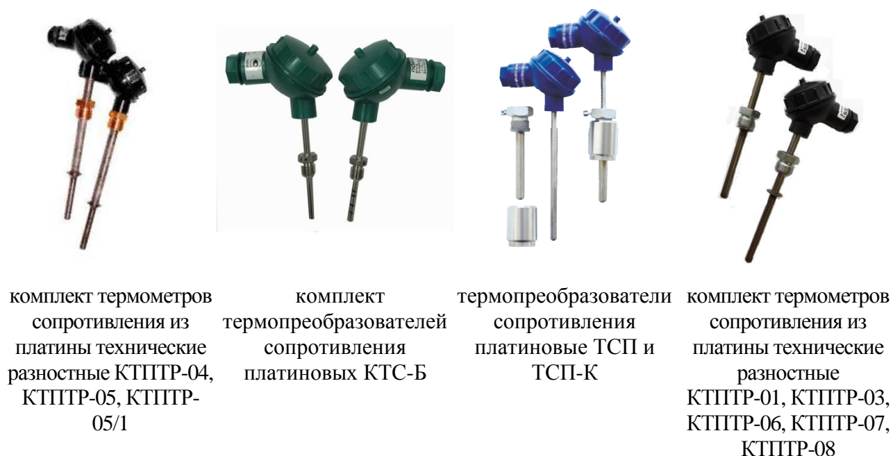
Рисунок 3 – Общий вид средств измерений температуры измеряемой среды

В зависимости от назначения теплосчетчика и исполнения вычислителя теплосчетчики выпускаются в разных модификациях и маркируются следующим образом: