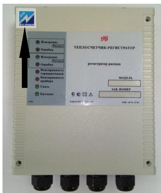
Рисунок 7 – Схема пломбировки от несанкционированного доступа, обозначение места нанесения знака поверки на корпус регистратора расхода раздельно-выносного исполнения