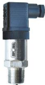
датчик избыточного давления с электрическим выходным сигналом ДДМ-03Т-ДИ

В качестве средств измерений давления в составе теплосчетчика могут применяться преобразователи давления измерительные СДВ (регистрационный номер 28313-11), датчики избыточного давления с электрическим выходным сигналом ДДМ-03Т-ДИ (регистрационный номер 55928-13). Общий вид средств измерений давления в составе теплосчетчика представлены на рисунке 1.