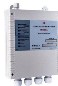
регистратор расхода раздельно-выносного исполнения ООО «ВТК Прибор»