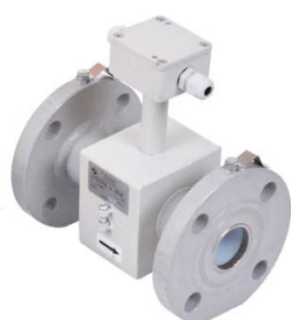
первичный преобразователь расхода ООО «ВТК Прибор»