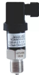
преобразователь давления измерительный СДВ