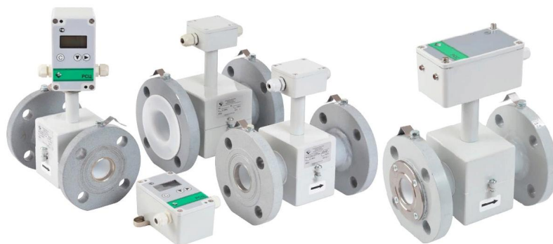
расходомеры-счетчики электромагнитные РСЦ

В качестве средств измерений объемного расхода жидкости и объема жидкости в потоке в составе теплосчетчика могут применяться: первичные преобразователи расхода в комплекте с регистратором расхода (производства ООО «ВТК Прибор» г. Киров) и/или расходомеры-счетчики электромагнитные РСЦ (регистрационный номер 71286-18). Общий вид средств измерений объемного расхода жидкости и объема жидкости в потоке в составе теплосчетчика представлены на рисунке 2.