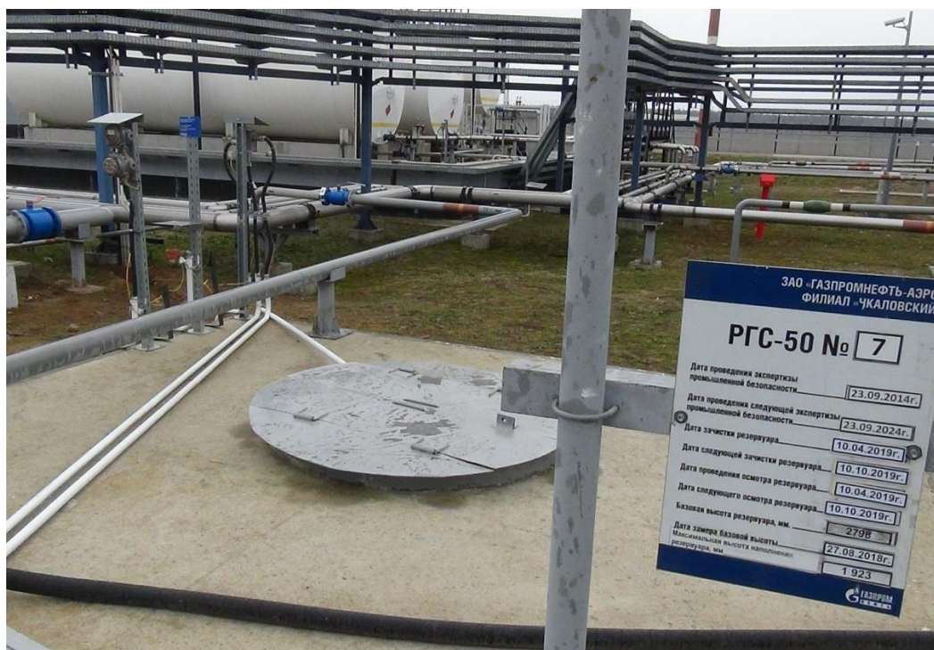
Рисунок 2 – Общий вид видимых частей конструкции РГСП-50 № 468