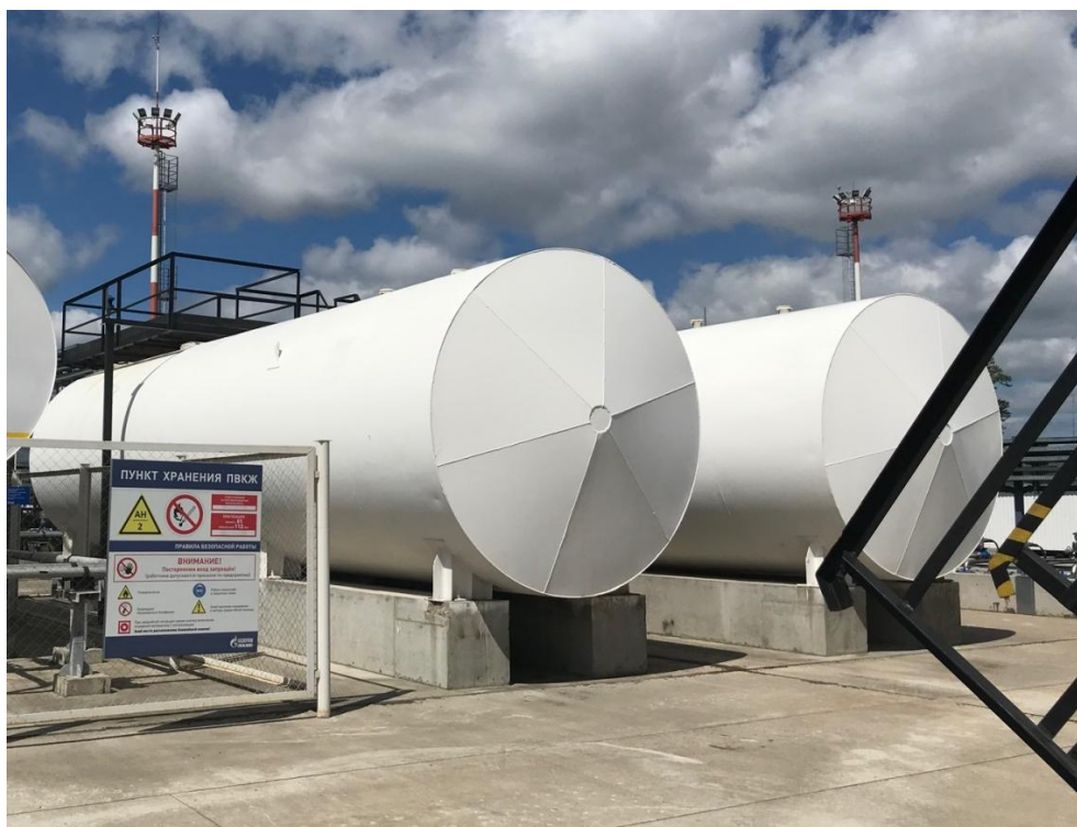
Рисунок 1 – Общий вид резервуаров РГС-100 №№ 465, 466

Общий вид резервуаров горизонтальных стальных цилиндрических РГС-100 №№ 465, 466 (№№ 5, 4 по технологической схеме соответственно), а также видимой части конструкций и эскиз резервуара горизонтального стального цилиндрического РГСП-50 № 468 (№ 7 по технологической схеме) представлены на рисунках 1-3.