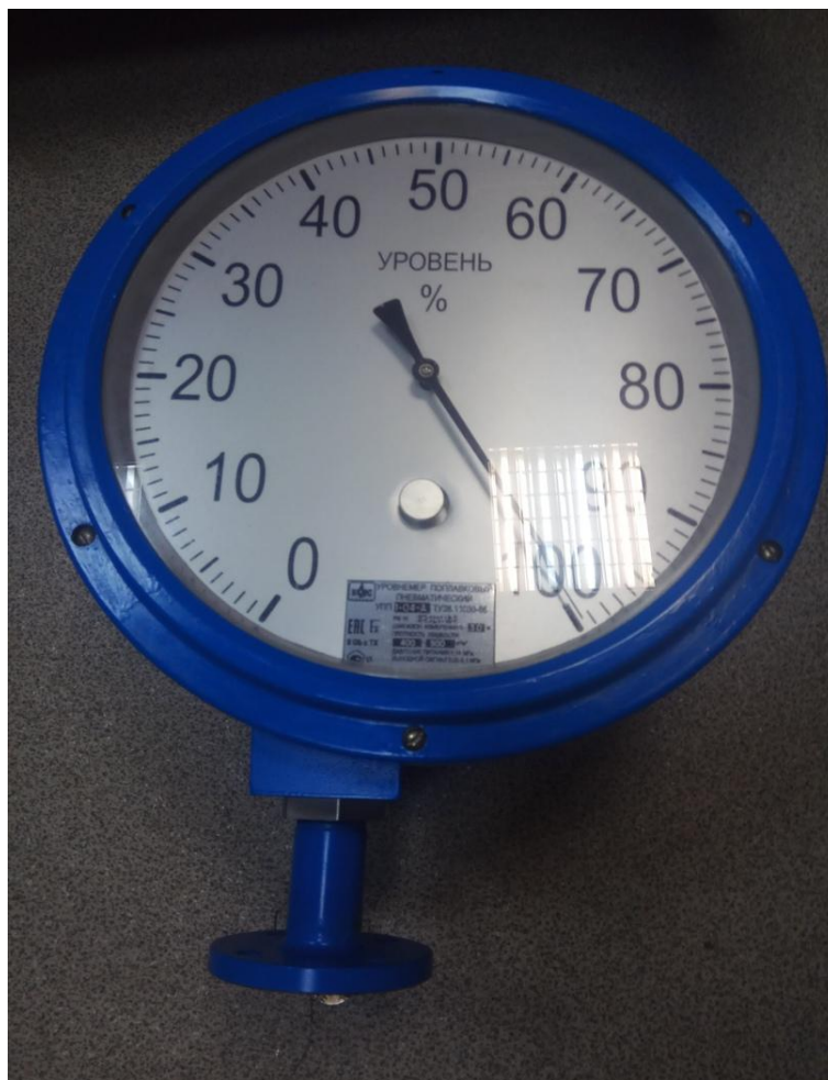
Рисунок 1 – Вид спереди уровнемеров