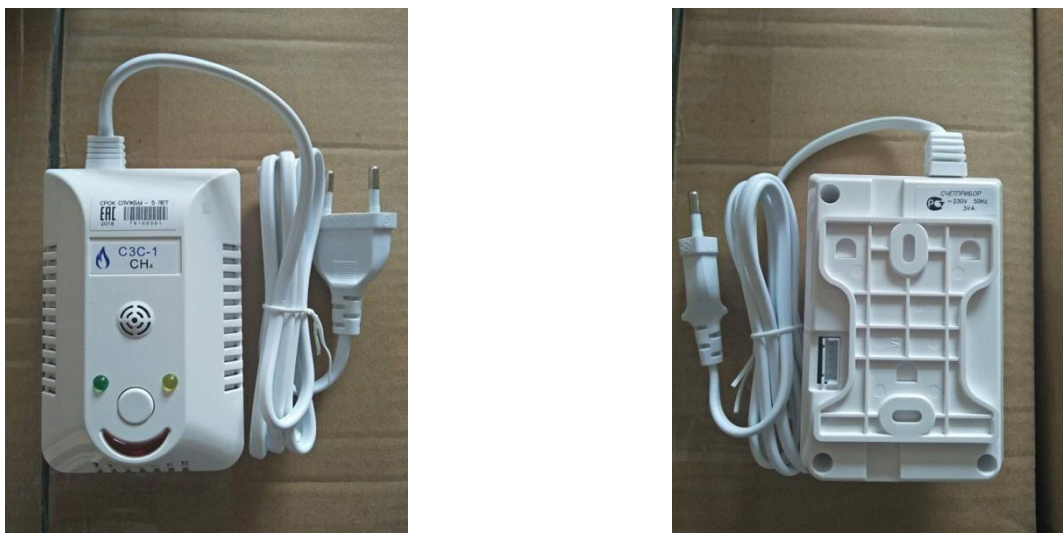
Рисунок 1 – Общий вид сигнализаторов «Счетприбор» СЗС