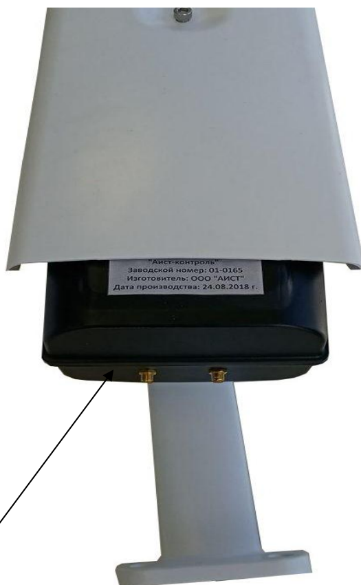
Рисунок 2 – Схема пломбировки от несанкционированного доступа и маркировки комплексов

Схема пломбировки от несанкционированного доступа и маркировки комплексов представлена на рисунке 2.