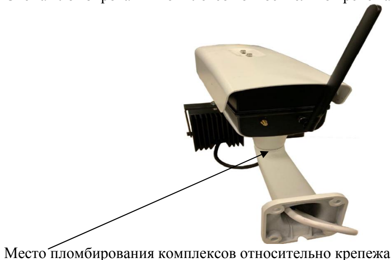
Рисунок 3 – Схема пломбирования комплексов относительно крепежа

Схема пломбирования комплексов относительно крепежа представлена на рисунке 3.