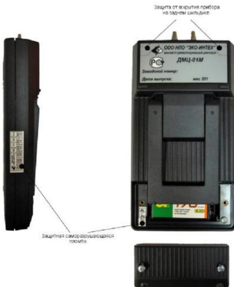
Рисунок 2 – Схема пломбирования дифманометра ДМЦ-01М

1- Входной участок с сеточными фильтрами, 2 – корпус, 3 –ПК, 4 – трубка Пито, 5 - вентилятор, 6– электродвигатель,7 – преобразователь частоты, 8 – рама, 9 – дифманометр ДМЦ-01М, 10-лимб, 11 – анемометр ЭА-70