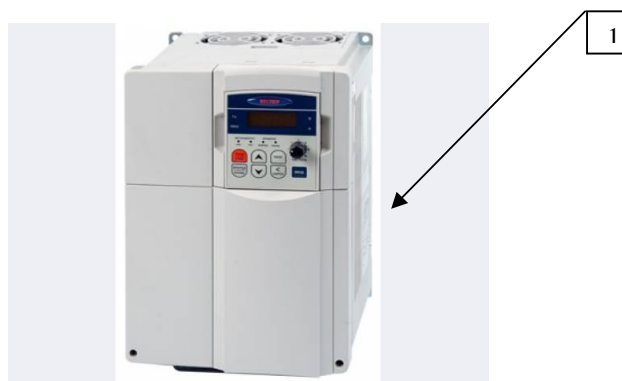
Рисунок 3 – Схема пломбирования преобразователя частоты E2-8300-007-H 1 – пломба