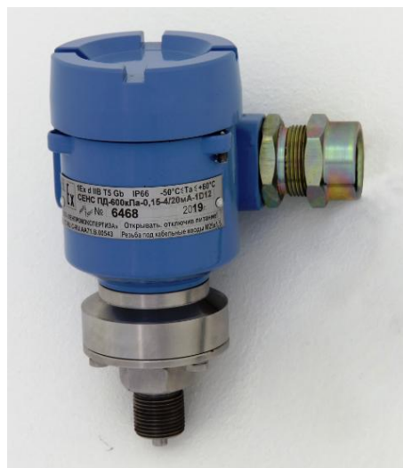
Рисунок 1 – Общий вид преобразователя давления измерительного СЕНС ПД

Предусмотрена возможность пломбирования. Схема пломбировки от несанкционированного доступа представлена на рисунке 2.