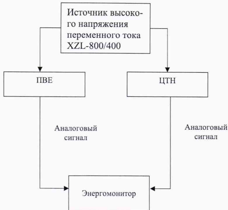
Рисунок 3 – Структурная схема определения метрологических характеристик при измерении напряжения переменного тока (для аналоговых выходов)

3) При помощи источника высокого напряжения переменного тока XZL-800/400 воспроизвести номинальное значение испытательного напряжения переменного тока на поверяемый ЦТН и ПВЕ в зависимости от номинального значения напряжения.