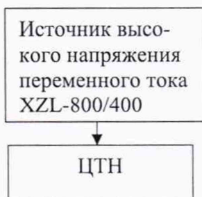
Рисунок 1 – Структурная схема определения электрической прочности изоляции