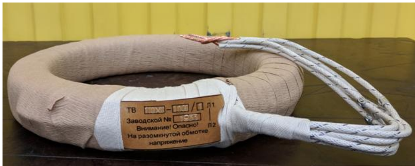
Рисунок 2 – Общий вид трансформаторов тока серии ТВ