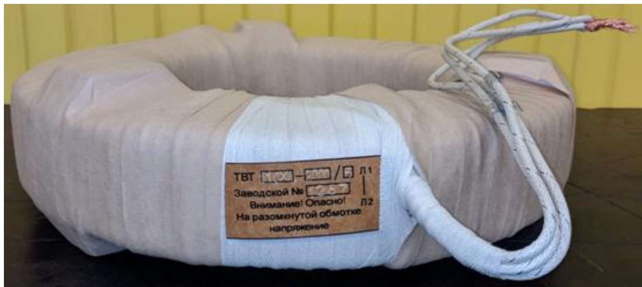
Рисунок 1 – Общий вид трансформаторов тока серии ТВТ