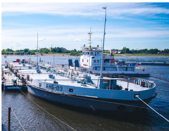
Рисунок 1 - Общий вид судов АНБ

Общий вид судов АНБ представлен на рисунке 1. Схема расположения резервуаров РГС-100, РГС-260 и РГС-280 представлена на рисунках 2 и 3.