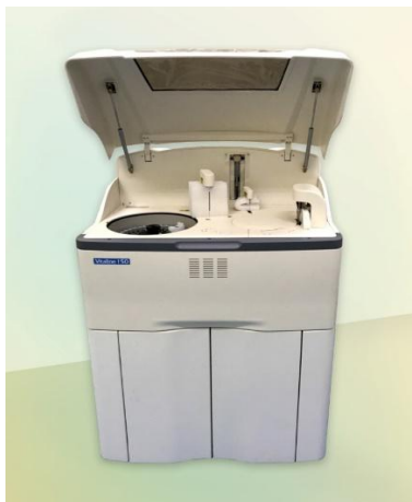
Рисунок 1 - Общий вид анализатора автоматического для биохимического и иммунотурбидиметрического анализа «ВитаЛайн 150» (VitaLine 150)

Схема пломбировки от несанкционированного доступа, обозначение места нанесения знака поверки представлены на рисунке 2.