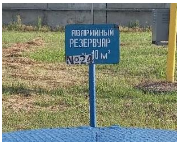
Рисунок 1 – Место нанесения заводского номера

Нанесение знака поверки на средство измерений не предусмотрено.