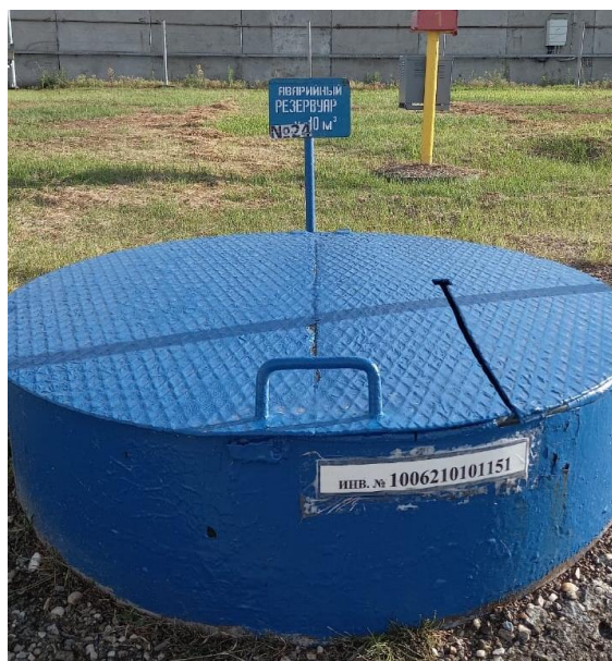
Рисунок 2 – Общий вид резервуара РГС-10