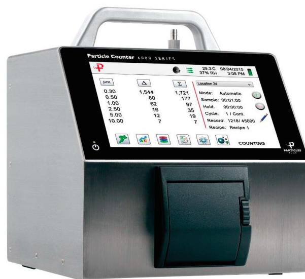
г) серия 6000