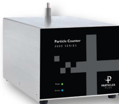
б) серия 3000