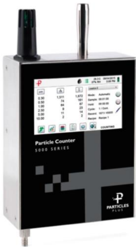
в) серия 5000