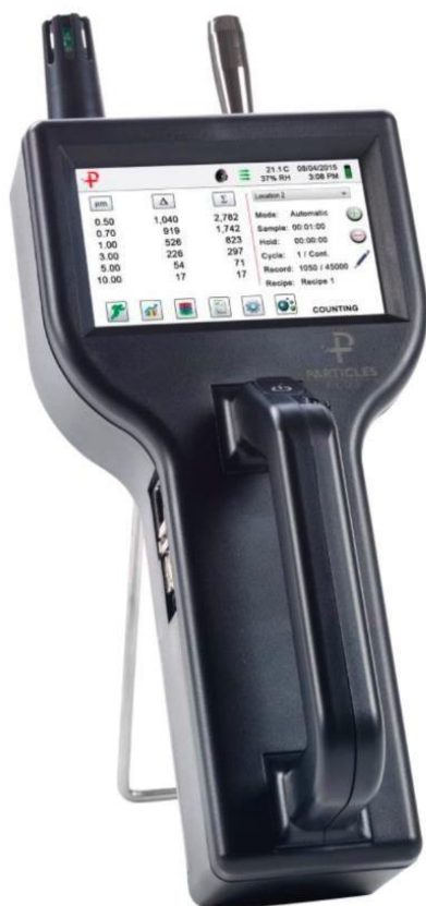
б) серия 8000