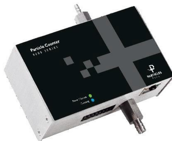
в) серия 9000