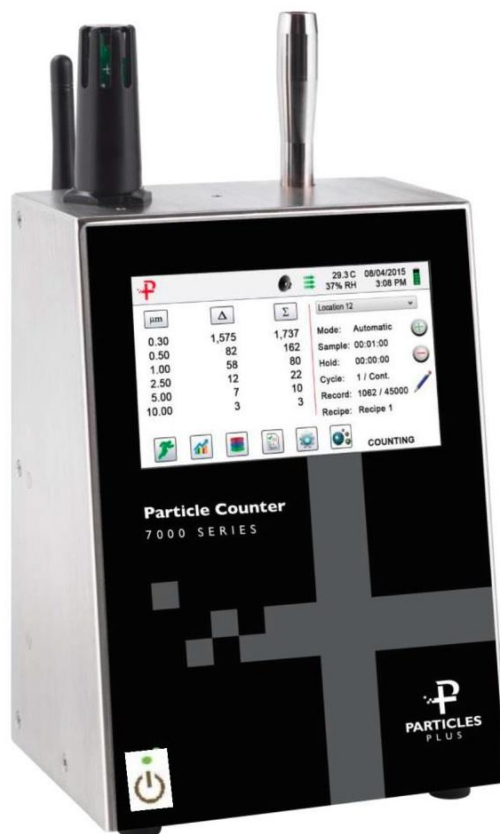
а) серия 7000