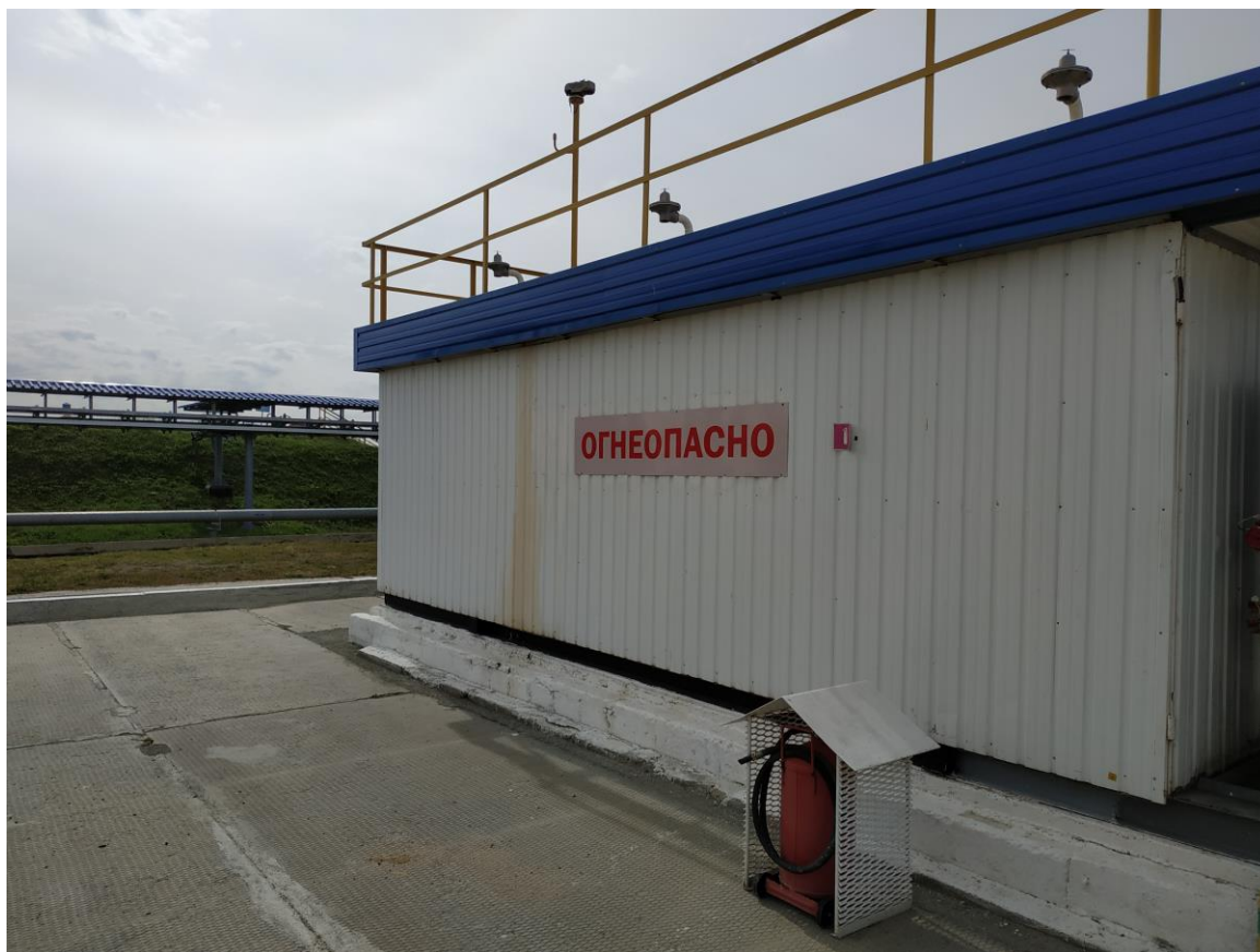
Рисунок 2 – Общий вид резервуаров РГС-10