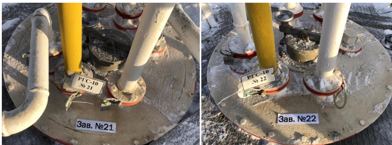
Рисунок 1 – Место нанесения заводских номеров

Нанесение знака поверки на средство измерений не предусмотрено.