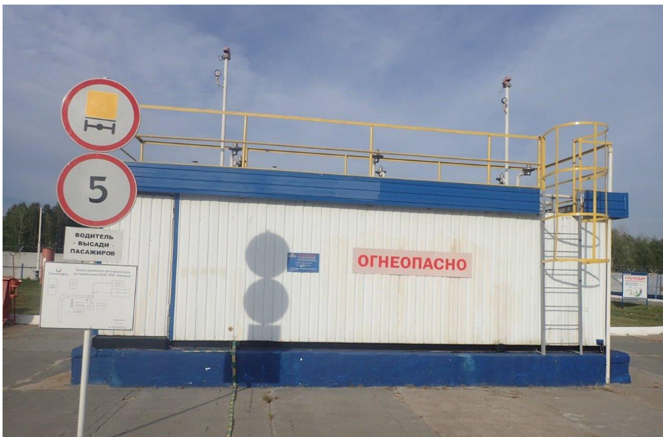
Рисунок 2 – Общий вид резервуаров РГС-10