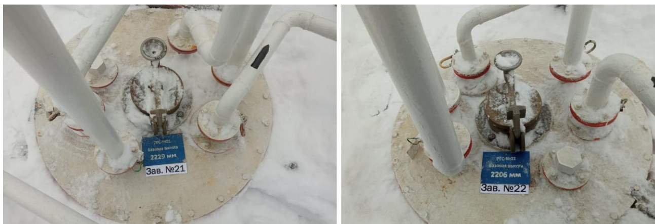
Рисунок 1 – Место нанесения заводских номеров

Нанесение знака поверки на средство измерений не предусмотрено.