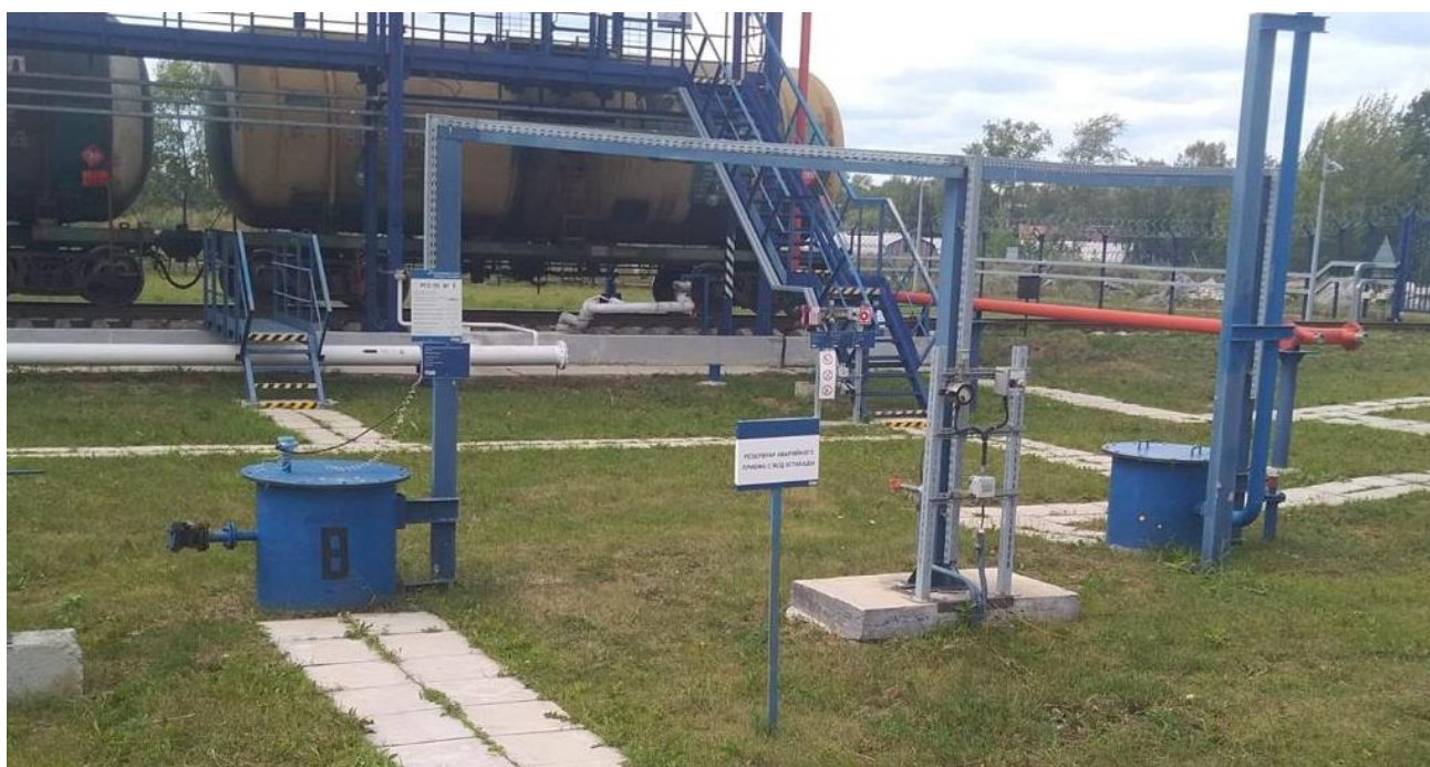
Рисунок 2 – Общий вид резервуара РГС-75