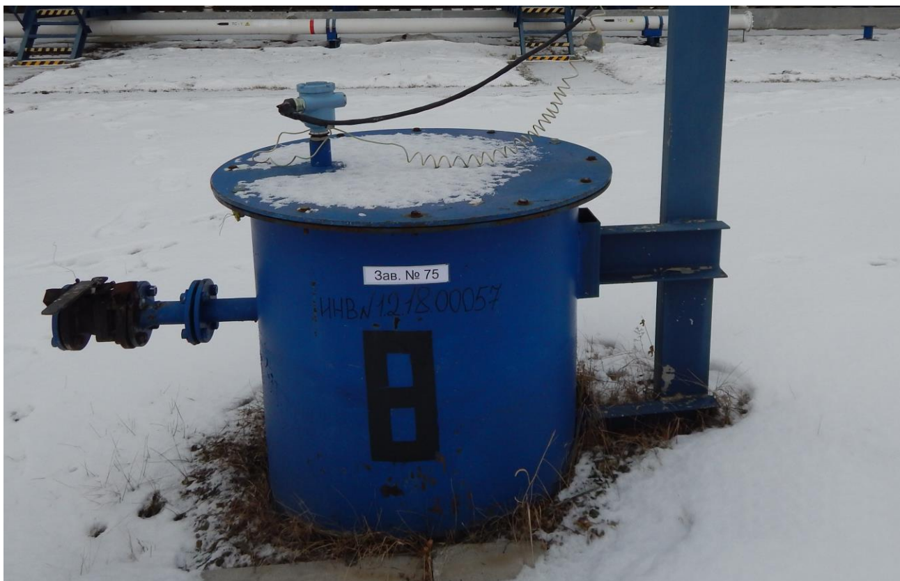
Рисунок 1 – Место нанесения заводского номера