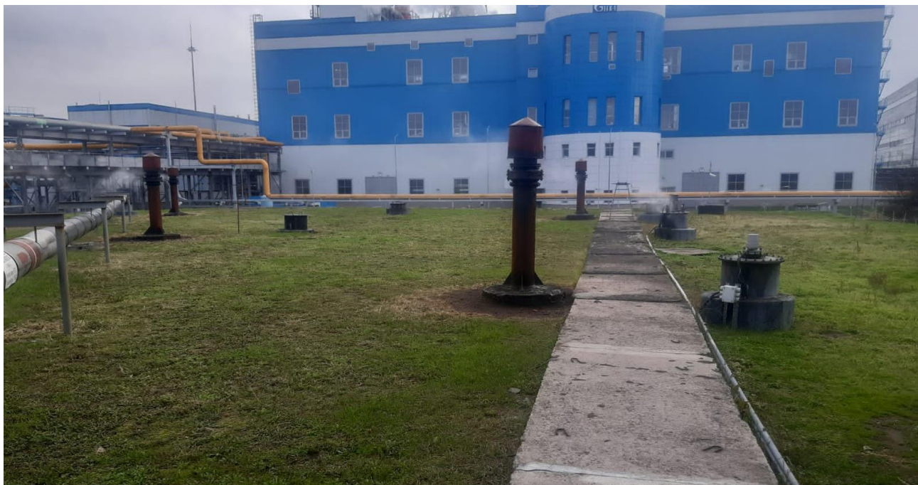
Рисунок 2 – Общий вид резервуара РЖБП-10000