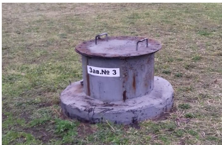
Рисунок 1 – Место нанесения заводского номера

Нанесение знака поверки на средство измерений не предусмотрено.