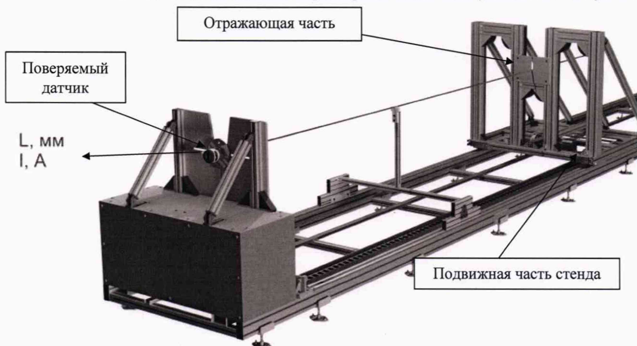
Рисунок 1 - Поверка датчика на поверочной установке с имитацией изменения уровня 1)

1) Примечание - при проведении поверки датчиков с жестким зондом. При поверке уровнемеров с тросовым зондом используется лебедка для создания необходимого натяжения троса для исключения провисания.