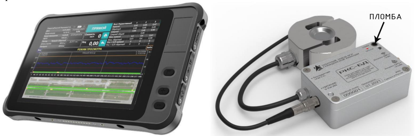
Рисунок 1 – Общий вид блока регистрации измерительного РКС и схема пломбировки от несанкционированного доступа

Заводской номер указывается на фирменной табличке, расположенной на задней крышке планшета.