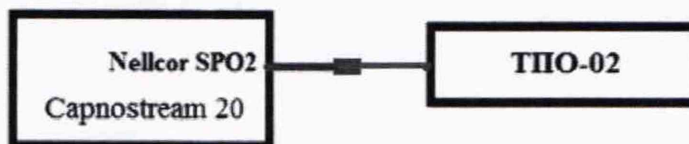
Рисунок 3 – Условная схема подключения

Согласно руководству по эксплуатации в тестере пульсовых оксиметров ТПО-02 устанавливаем тип датчика «Nellcor», вид кривой PLE1, частота пульса-70 мин -1 .