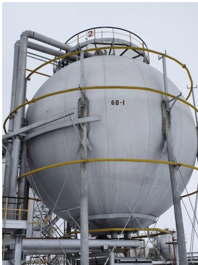
Рисунок 1 – Общий вид резервуаров РШС-600