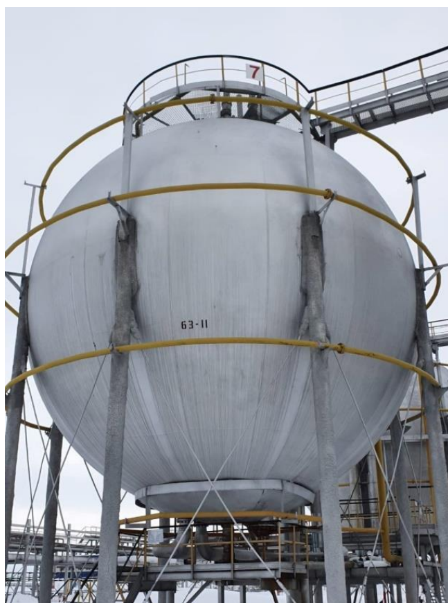
Рисунок 6 – Общий вид резервуаров РШС-600