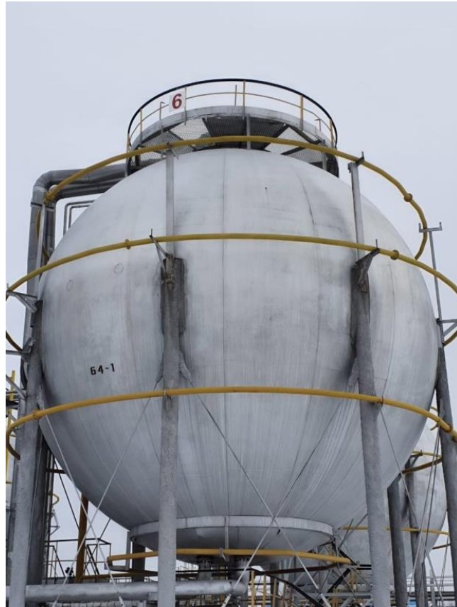
Рисунок 7 – Общий вид резервуаров РШС-600