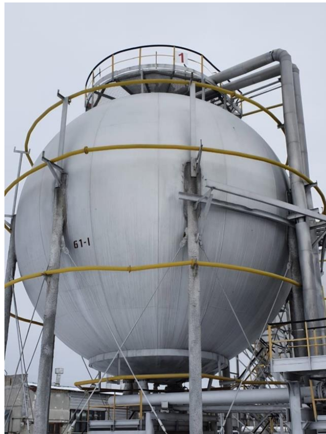
Рисунок 3 – Общий вид резервуаров РШС-600