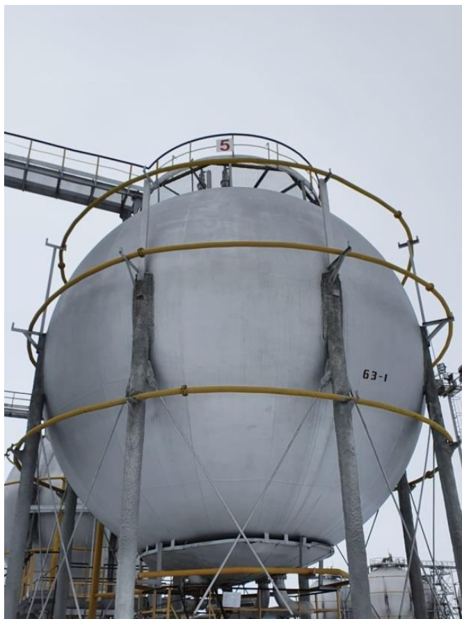
Рисунок 5 – Общий вид резервуаров РШС-600