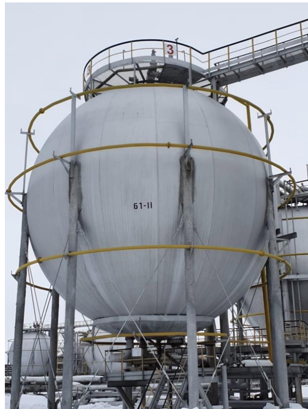
Рисунок 4 – Общий вид резервуаров РШС-600