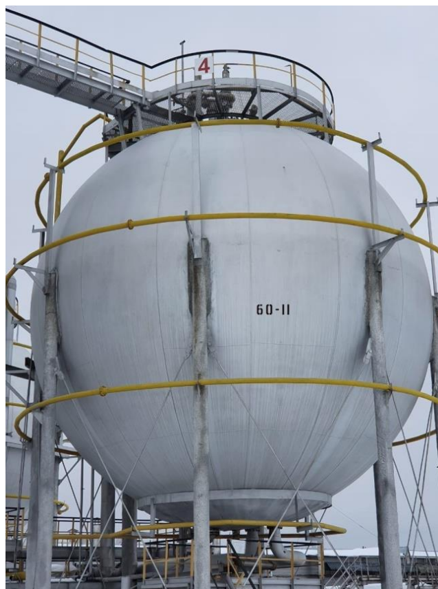
Рисунок 2 – Общий вид резервуаров РШС-600