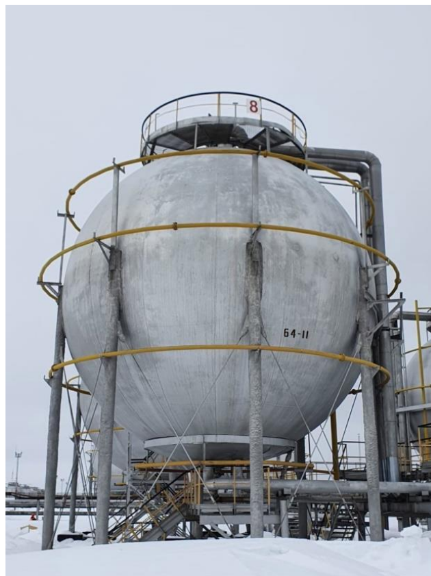
Рисунок 8 – Общий вид резервуаров РШС-600