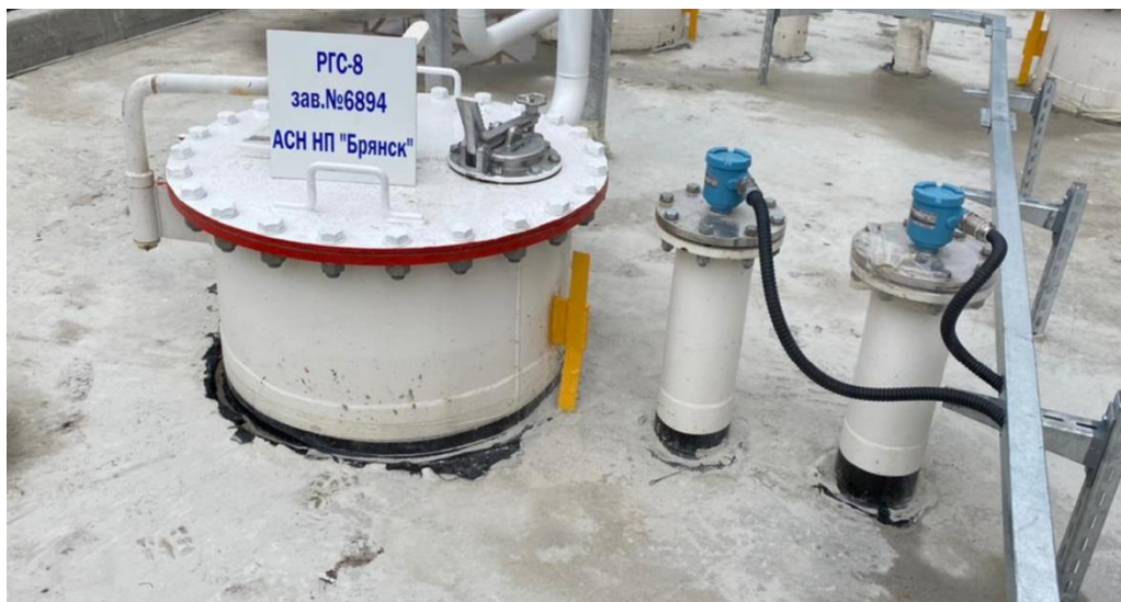
Рисунок 1 – Общий вид резервуара РГС-8

Общий вид и эскиз резервуара представлены на рисунках 1-2.