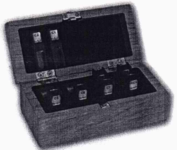
Рисунок 1.2 – Внешний вид комплектов светофильтров КСС-02, КСС-04