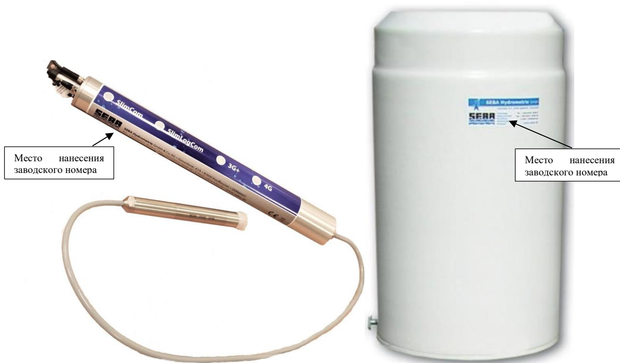
Рисунок 2 - Общий вид комплекса Levellogger, исполнения АГК-1 и АГК-2 с указанием места нанесения заводского номера (Контроллер SlimLogCom2EL и датчик DST-22– слева, датчик количества жидких осадков RG-50 - справа)