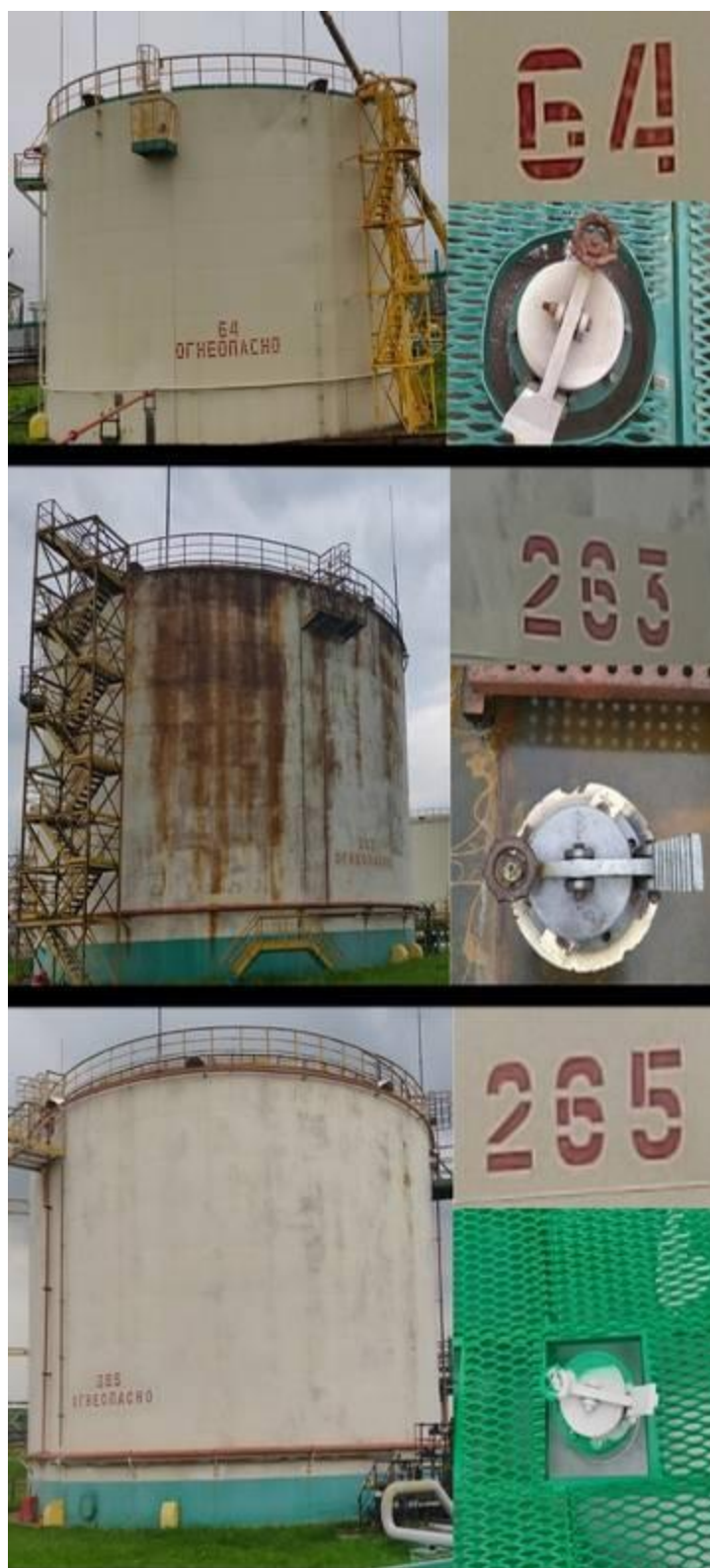
Рисунок 1 – Общий вид резервуаров стальных вертикальных цилиндрических с понтоном РВСП-3000 №64, РВСП-5000 №№263, 265 их горловин и заводских номеров