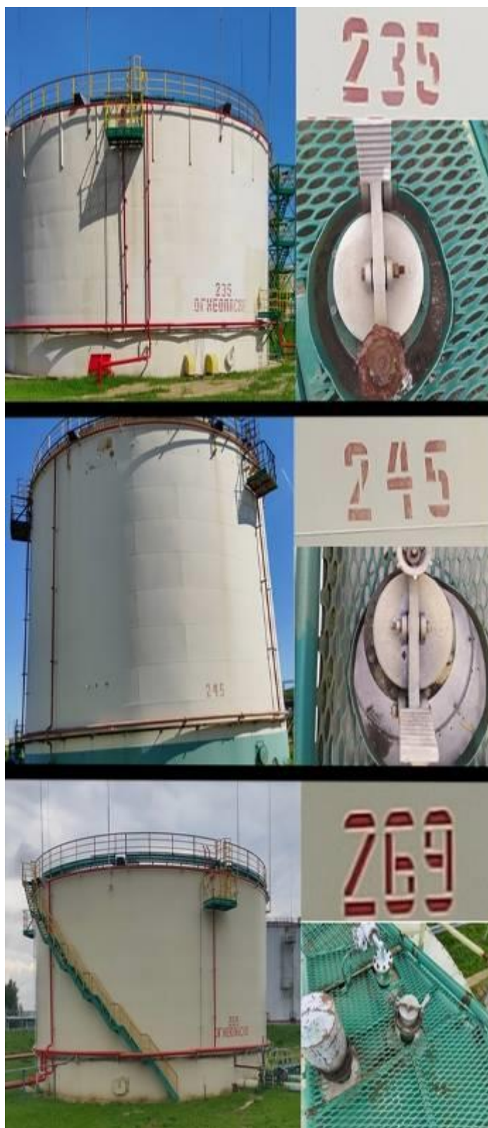
Рисунок 2 – Общий вид резервуаров стальных вертикальных цилиндрических с понтоном РВСП-5000 №№235, 245, 269 их горловин и заводских номеров