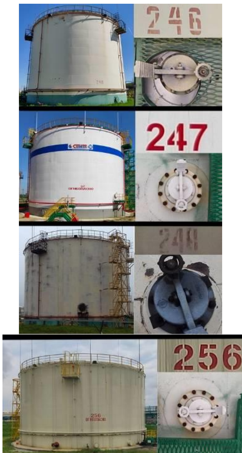
Рисунок 3 – Общий вид резервуаров стальных вертикальных цилиндрических с понтоном РВСП-5000 №№246, 247, 248, 256 их горловин и заводских номеров