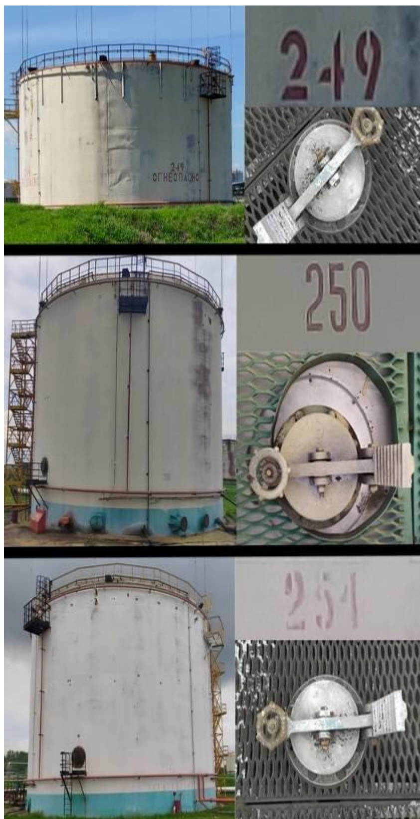
Рисунок 4 – Общий вид резервуаров стальных вертикальных цилиндрических с понтоном РВСП-5000 №№249, 250, 251 их горловин и заводских номеров