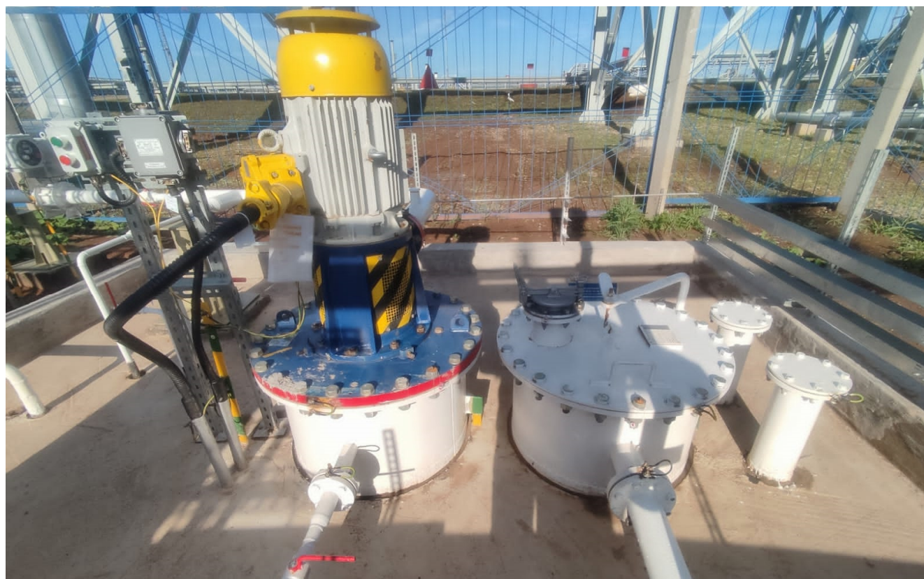
Рисунок 2 – Общий вид резервуара ЕП-5-1600-600-А-С-У1