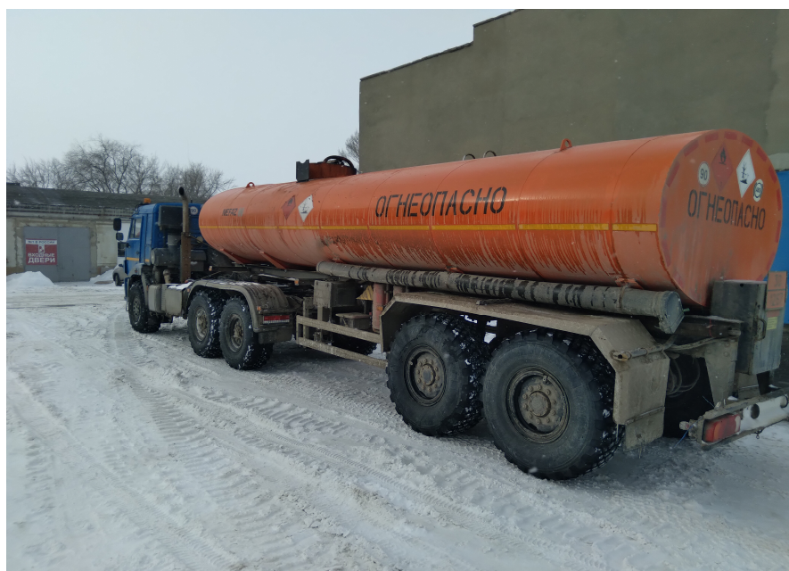
Рисунок 1 – Общий вид Полуприцепа-цистерны НЕФАЗ 96742-04