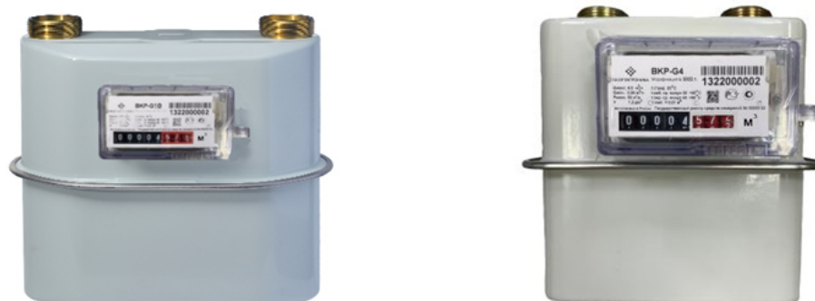
Рисунок 1б - Общий вид основных исполнений счетчиков ВКР конструкции Б