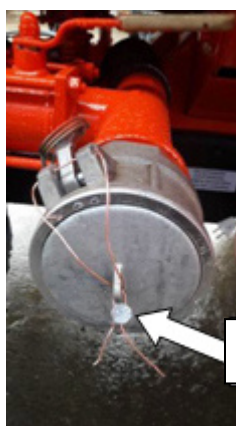
Рисунок 2 – Пломбировка трубопровода слива-налива