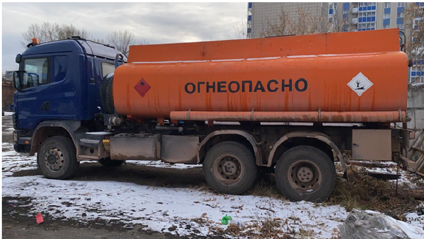
Рисунок 1 – Общий вид автоцистерны для жидких нефтепродуктов АЦ-17