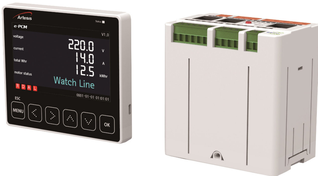
Рисунок 1 – Общий вид систем e-PCM