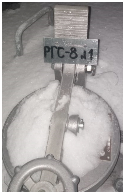
Рисунок 2 – Фотография горловины и заводского номера резервуара стального горизонтального цилиндрического РГС-8, заводской номер 1

Пломбирование резервуара стального горизонтального цилиндрического РГС-8 не предусмотрено.