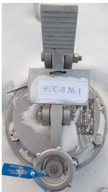
Рисунок 2 – Фотография горловины и заводского номера резервуара стального горизонтального цилиндрического РГС-8, заводской номер 1

Пломбирование резервуара стального горизонтального цилиндрического РГС-8 не предусмотрено.