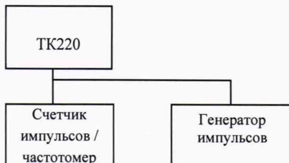
Рисунок 1 – Схема подключения генератора импульсов и частотомера

7.4 В случае использования в качестве средства воспроизведения импульсного сигнала генератор импульсов и частотомер, собирают схему согласно рисунка 1.