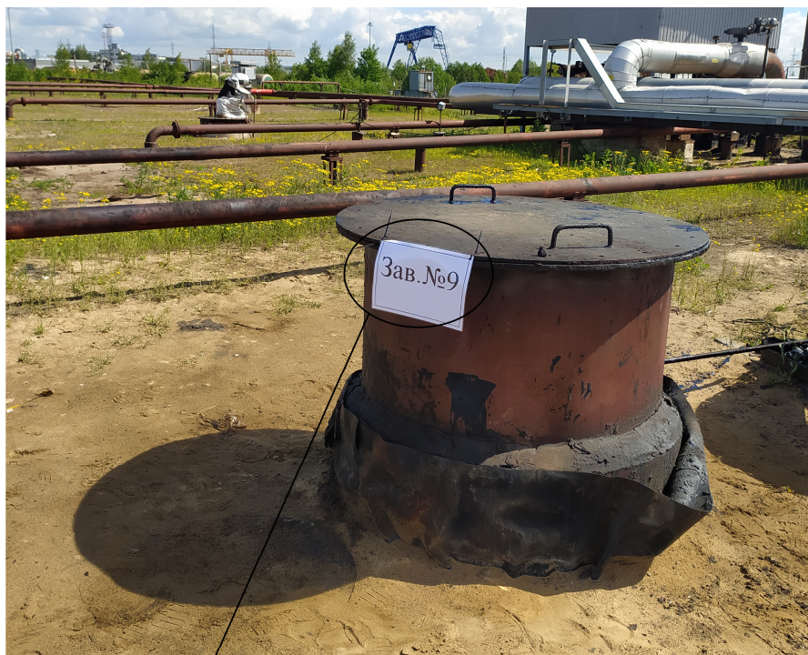
Место нанесения заводского номера