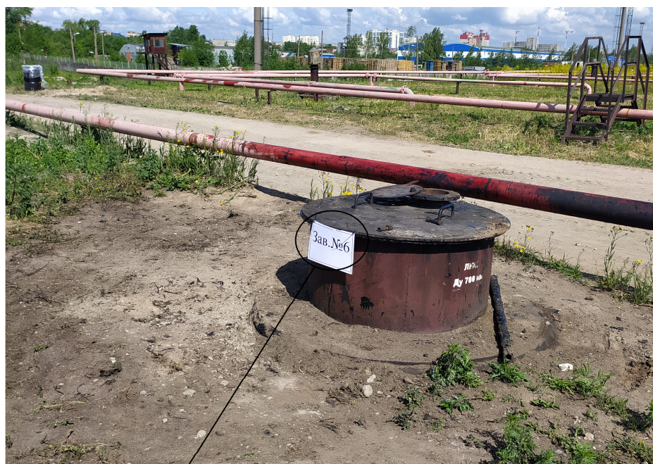
Место нанесения заводского номера