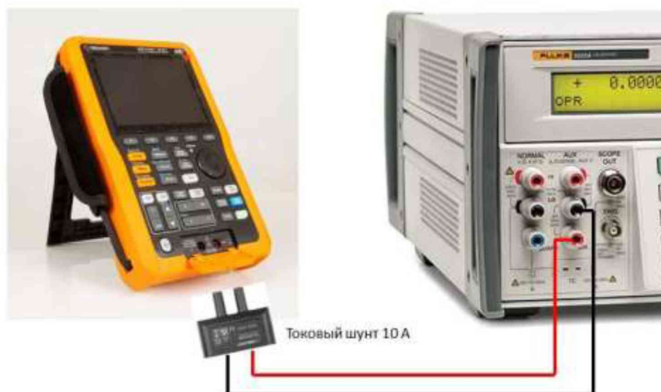
Рисунок 5 – Схема соединения приборов при определении погрешности измерения силы постоянного и переменного тока на пределах 6 А и 10 А