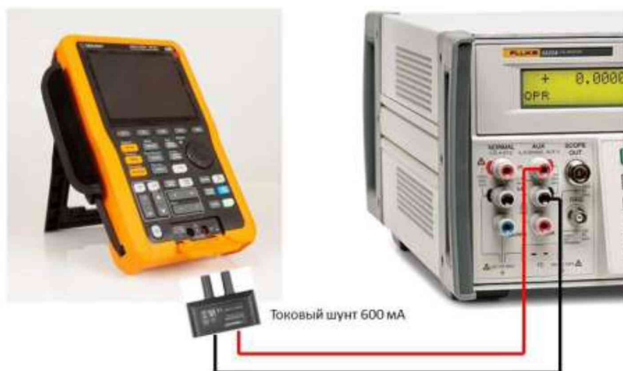
Рисунок 4 – Схема соединения приборов при определении погрешности измерения силы постоянного и переменного тока на пределах 60 и 600 мА

9.10.3 На калибраторе установить поочередно значения силы постоянного и переменного тока в соответствии с таблицами 13 – 14. Зафиксировать показания осциллографа-мультиметра и занести их в соответствующую таблицу.