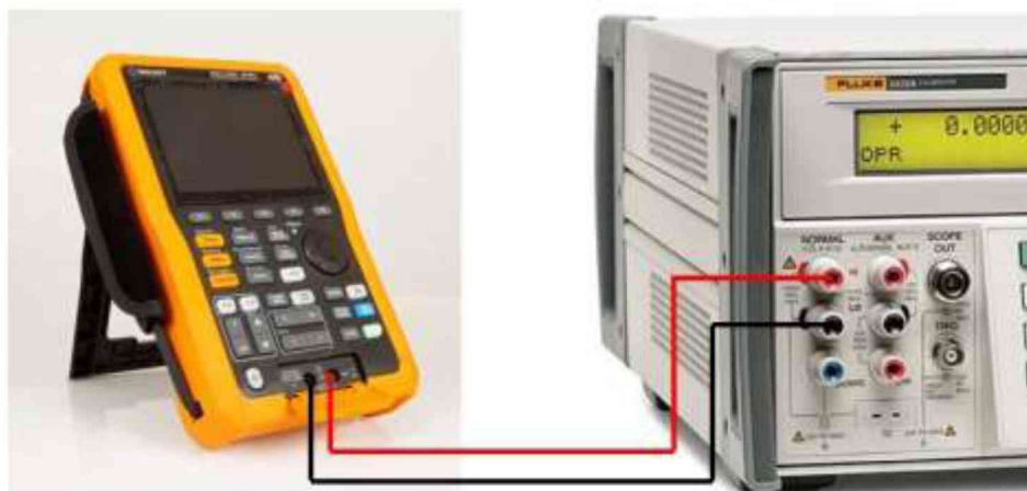
Рисунок 3 – Схема соединения приборов при определении погрешности измерения напряжения постоянного и переменного тока, электрического сопротивления постоянному току, электрической емкости

9.6.2 Подключить осциллограф-мультиметр к калибратору согласно рисунку 3.