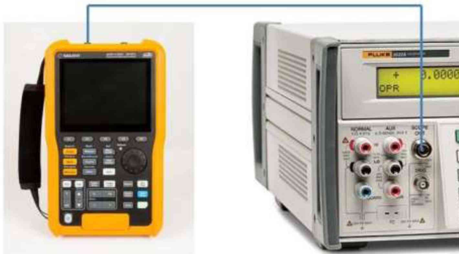
Рисунок 1 - Схема соединения приборов при определении погрешности измерения напряжения постоянного тока и коэффициентов отклонения, определении погрешности измерения импульсного напряжения, проверке ширины полосы пропускания каналов

9.1.1 Подключить калибратор к входу канала осциллографа-мультиметра согласно рисунку 1.