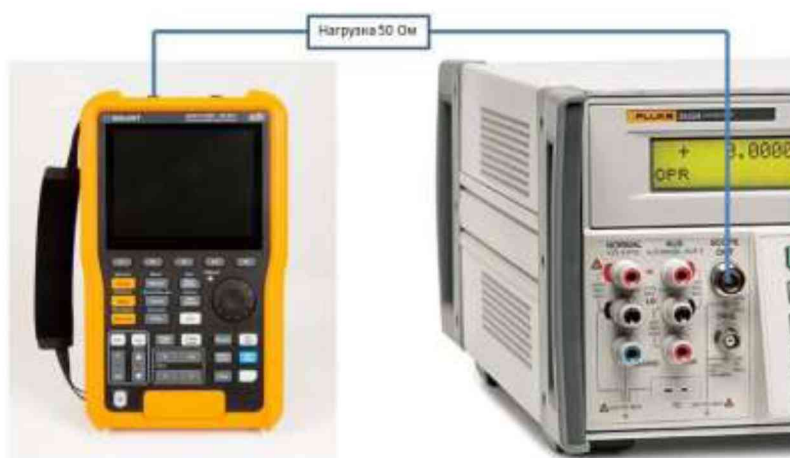
Рисунок 2 – Схема соединения приборов при определении времени нарастания переходной характеристики и определении относительной погрешности частоты внутреннего опорного генератора.

9.4.5 Повторить измерения по п.п. 9.4.1 – 9.4.5 для коэффициентов отклонения, устанавливаемых из ряда: 5, 10, 20, 50, 100, 200, 500 мВ/дел, 1 В/дел.