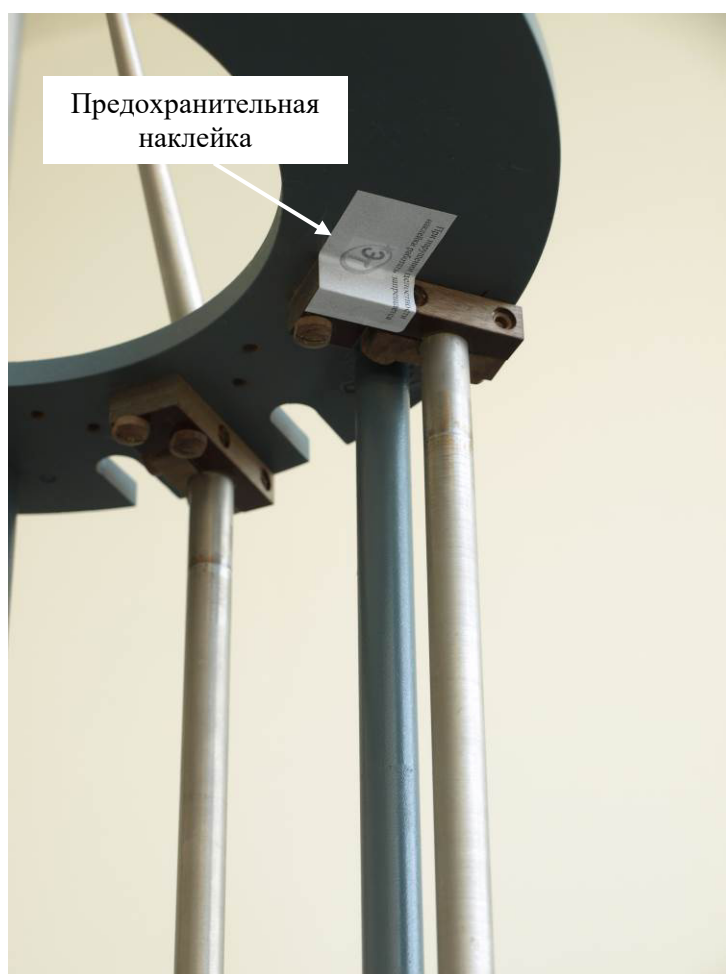
Рисунок 3 — ЭМП-2. Вид снизу. Схема пломбирования от несанкционированного доступа