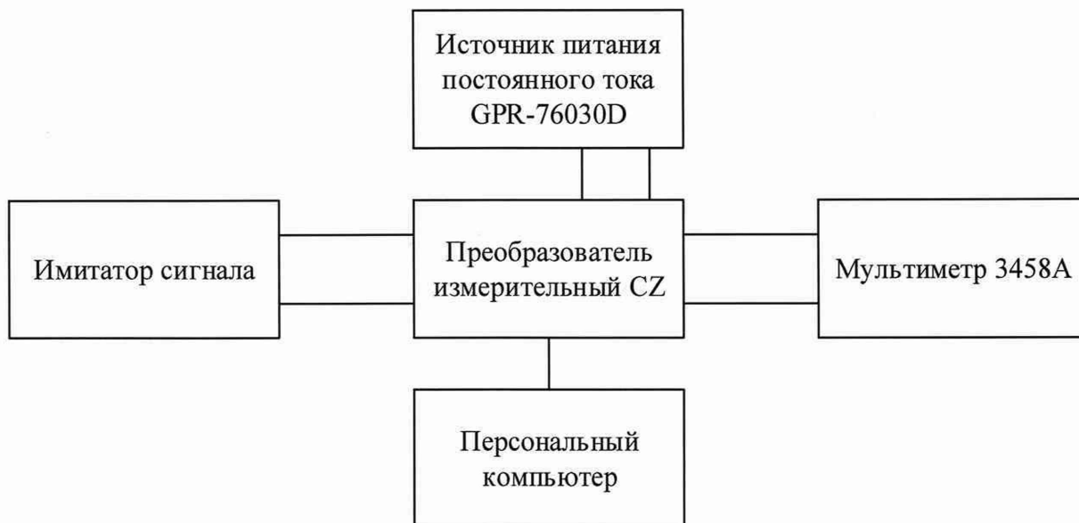
Рисунок А.1 – Схема определения основной приведенной (к верхнему пределу диапазона входного сигнала) погрешности преобразований Имитатор сигналов - Калибратор многофункциональный и коммуникатор ВЕАМЕХ МС6 (-R), Мера электрического сопротивления постоянного тока многозначная МС3070М-1, Генератор сигналов специальной формы АКИП-3409/1