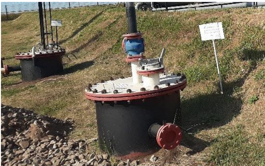
Рисунок 3 – Горловины и измерительный люк резервуара

Пломбирование резервуара РГС-40 не предусмотрено.