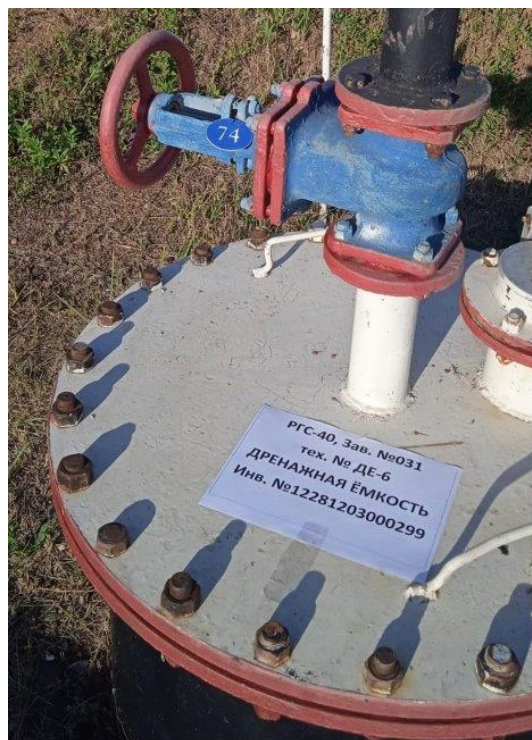
Рисунок 1 – Место нанесения заводского номера