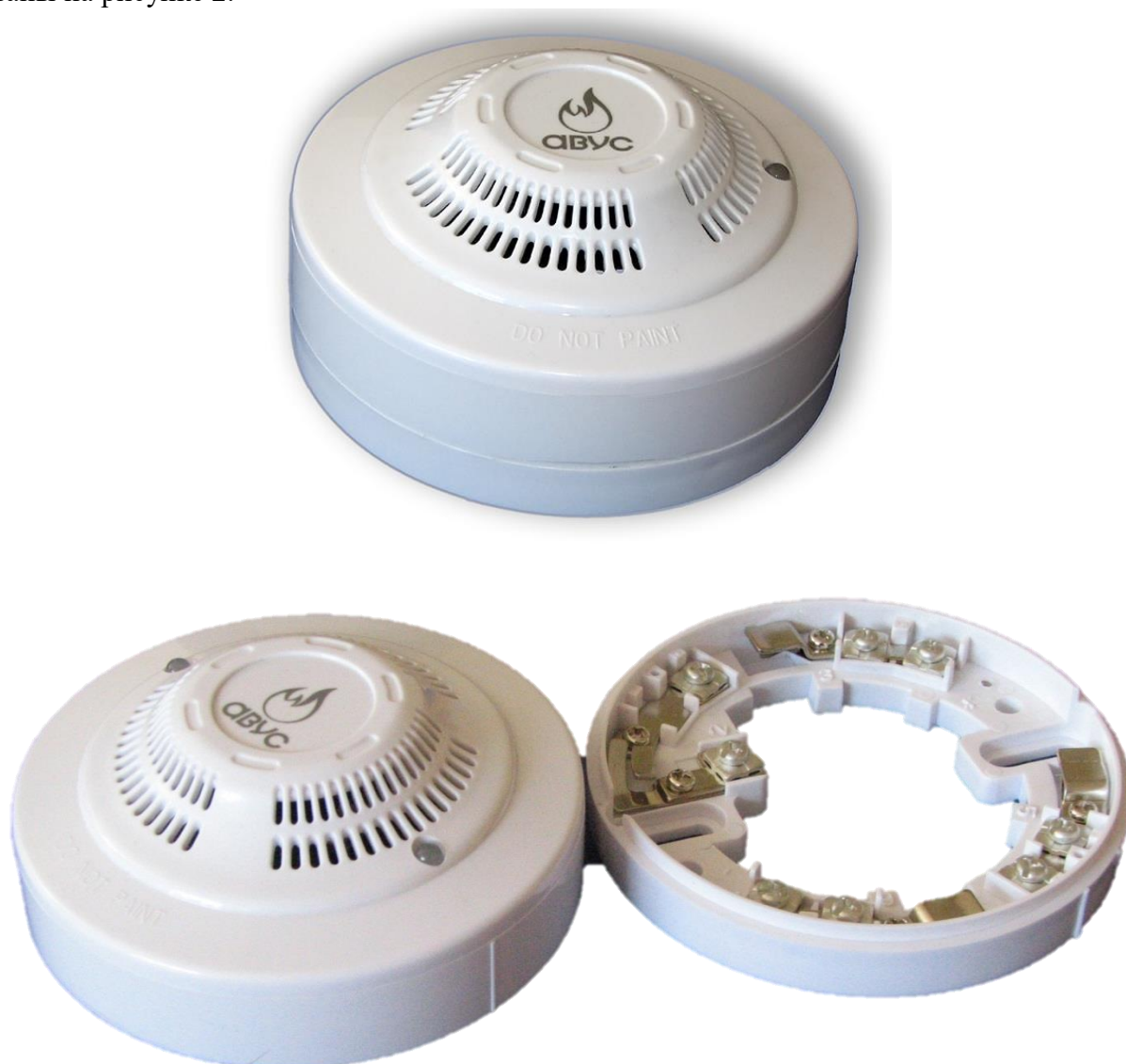
Рисунок 1 – Общий вид газосигнализаторов

Общий вид сигнализаторов приведен на рисунке 1. Места пломбировки от несанкционированного доступа с помощью наклейки пломбировочной и нанесения знака утверждения типа указаны на рисунке 2.