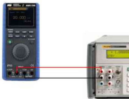
Рисунок 1 – Схема соединения приборов при определении погрешности измерения напряжения постоянного тока.

9.1.2 Подключить калибратор к 5522A согласно рисунку 1.