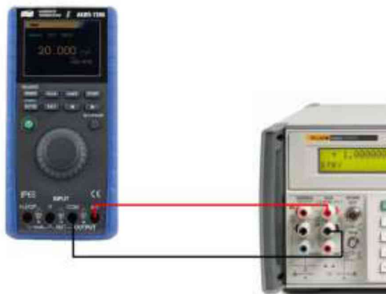
Рисунок 2 – Схема соединения приборов при определении погрешности измерения силы постоянного тока.

9.2.2 Подключить калибратор к 5522A согласно рисунку 2.